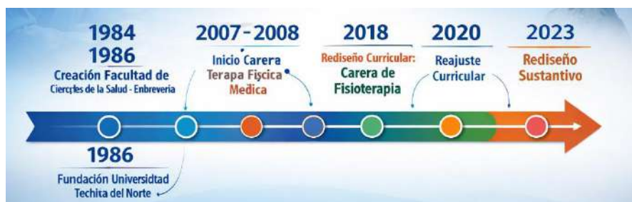
Figura 1 Línea de tiempo